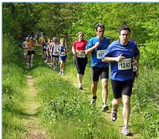
... und durch den frühlingserwachten Wald