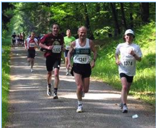
Laufen beim Frühlingslauf in St. Leon Rot auf flachem Asphalt ...

Frühlingslauf in St. Leon-Rot. Dieser Name steht für breit gefächerten Laufsport. Zum Halbmarathon gesellt sich noch ein 10 km Wettkampf, aufgeteilt in die Wertungskategorien „Läufer“ und „Walker“, wobei die Walker sogar erst etwa 2 min nach den Läufern auf die Strecke entlassen werden, damit sie sich nicht falsch einordnen und mit ihren Stöcken im Weg sein können.