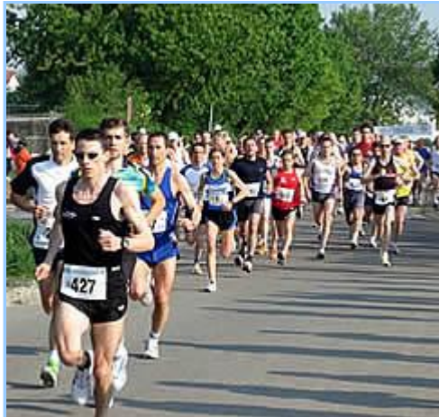
Start zum 10 km-Lauf