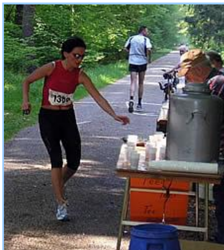
... die großen Läufer bei hohen Temperaturen den fliegenden Griff zum Becher üben